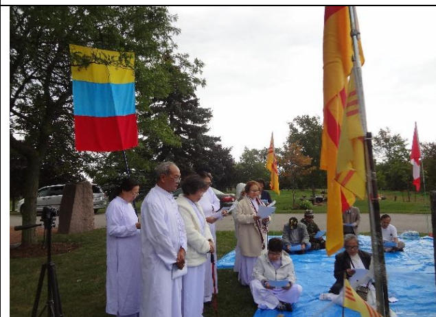
Hình 3: Lễ Cầu Siêu