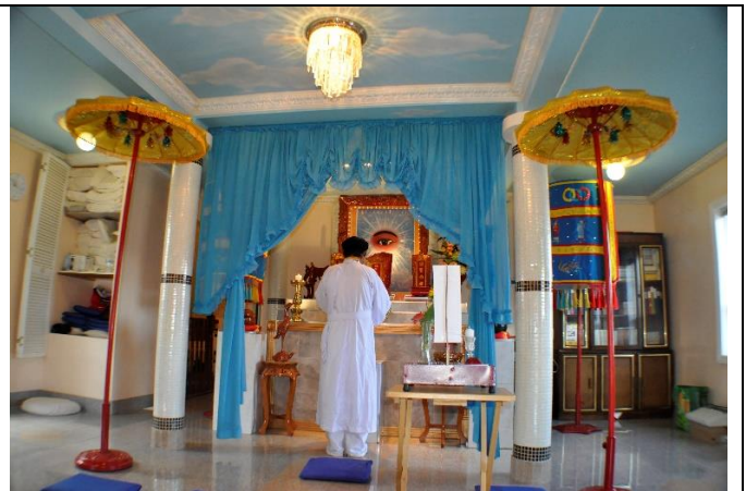
Hình 2: Ban Trị Sự chủ lễ cúng cửu