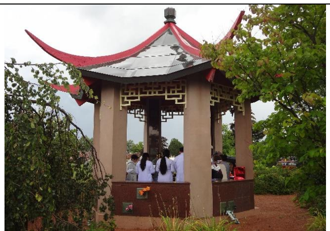
Hình 4: Tượng Đài Chiến Sĩ