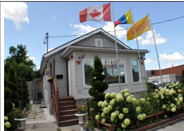
Hình 1: TTCĐ Kitchener Canada

Ngày 10 Tháng 7 Năm 2019, Thánh Thắt Cao Đài Kitchener-CANADA (Hình 1) chia thành 2 nhóm để phục vụ. Nhóm tại Thánh Thắt, Ban Trị Sự chủ lễ cúng cửu cho một vị đạo hữu vừa qua đời (Hình 2). Nhóm thứ hai, thì theo truyền thống hàng năm vào dịp Trung Nguyên, cùng với các Tôn Giáo bạn, cùng nhau làm Lễ Cầu Siêu cho các đấng linh hồn, chư vong linh tử nạn đao binh, bệnh chương được siêu thăng tinh độ. Lễ Cầu Siêu diễn (Hình 3) ra rất trang trọng tại Tượng đài Chiến Sĩ trận vong thuộc nghĩa địa Glen Oakes Memorial Garden Mississauga-Ontario (Hình 4)