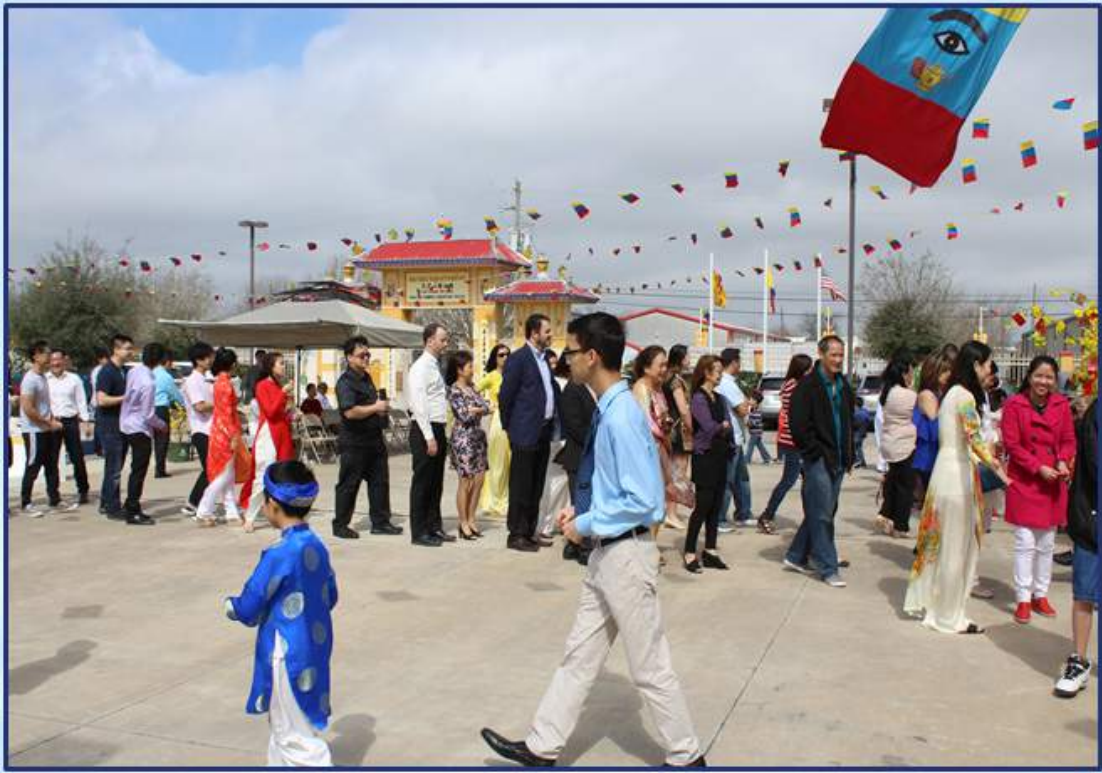
Hái lộc đầu Xuân - là một truyền thống để mang lại hạnh phúc cho gia đình.