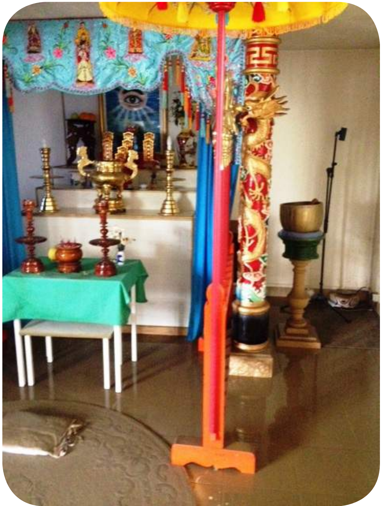
Lụt sà nhà