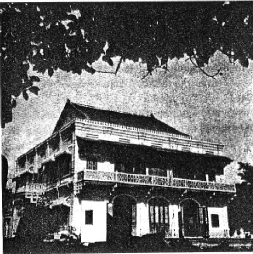
GIÁO TÔNG ĐƯỜNG NĂM 1932 NƠI LÀM VIỆC VÀ AN DƯỠNG CỦA ĐỨC QUYỀN GIÁO TÔNG LÊ VĂN TRUNG