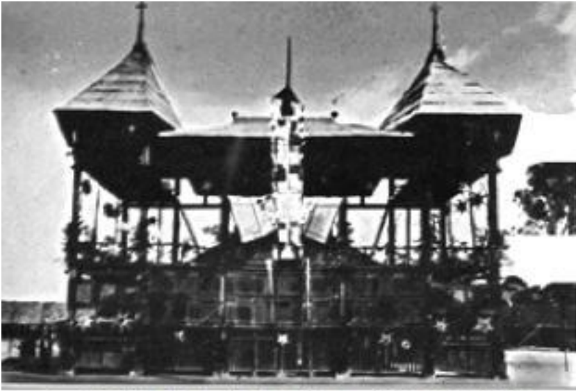
Cao Đài Tây Ninh - Thành thất tạm 1927 (ảnh tài liệu)

Sau đó, Đức Lý giảng cơ thu nhỏ hoạ đồ lại như sau :