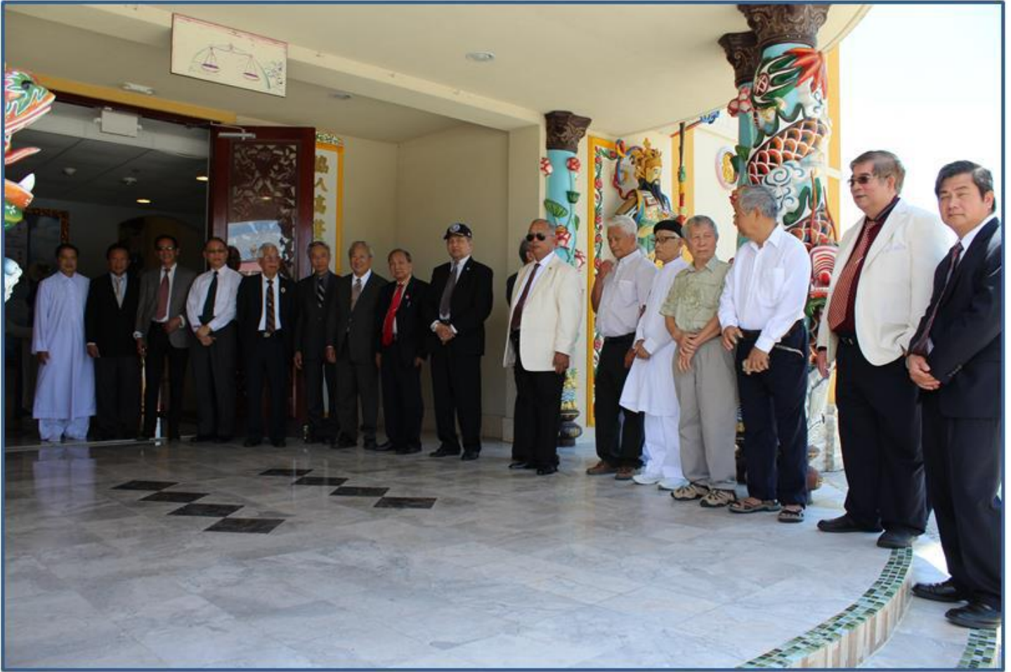
Khách thân hữu nhẫn nại đứng ngoài Chánh Điện, chờ Cúng xong vào Cung Nghinh

Ông còn nói thêm “chúng ta là một (We Are One)”. Chúng ta không phân biệt sắc tộc, màu da, tôn giáo. hãy lấy Thương Yêu và Công Lý làm đầu.